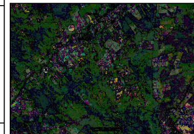
Situações Cartográficas Complementares